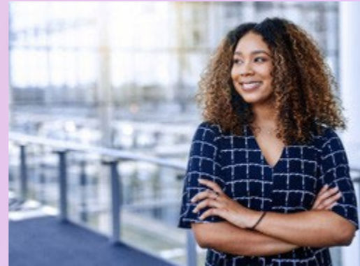
PRÁTICAS DE EMPREGO JUSTO