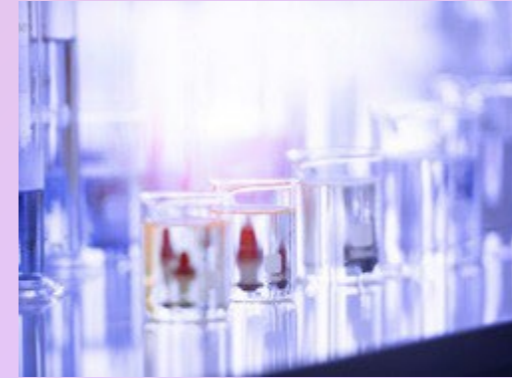
FRAUDE E CORRUPÇÃO