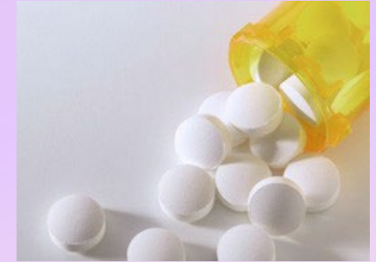
CONCORRÊNCIA LEAL, FIXAÇÃO DE PREÇOS E ANTITRUST